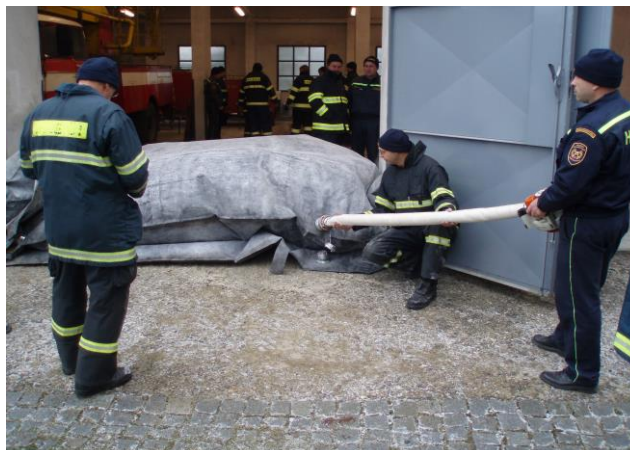
Obrázek 1: Mobilní protipovodňové bariéry