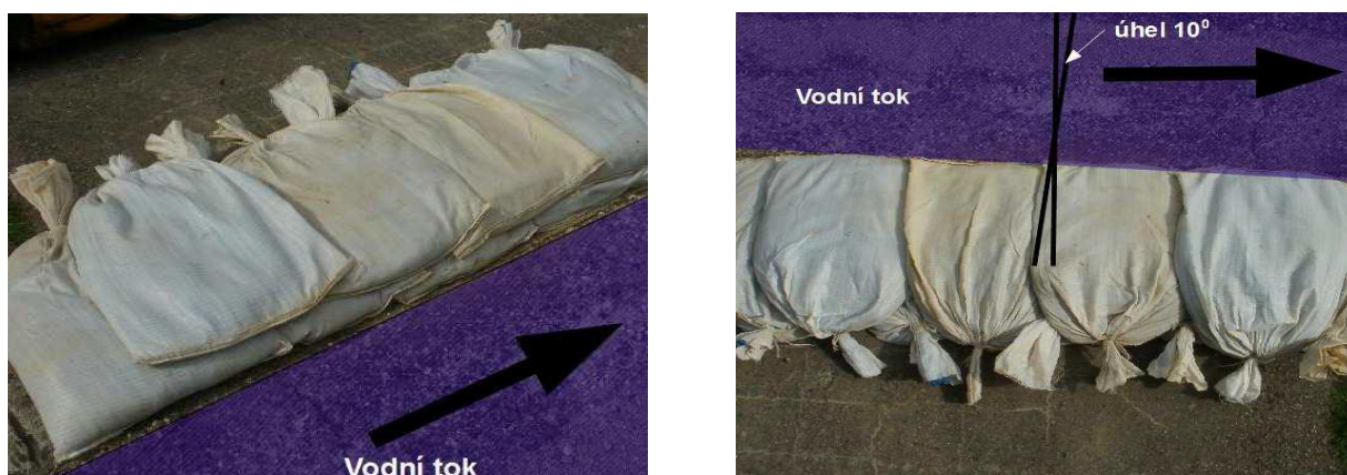
Obrázek 2: Jednořadé kladení pytlů